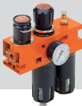
NEW DEAL : Metalen behuizing voor "heavy duty" toepassingen